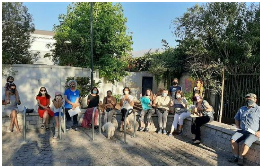
Cabildo plaza Teresa Salas Providencia 15 diciembre 2020.

Es un tema para evaluar porque yo misma he sido alérgica y he hecho tratamientos con medicinas alternativas que me han ayudado a superarlo, pero hemos evaluado que no es fácil encontrar especies que tengan las bondades en altura y frondosidad de aquellas. Con todo, en varias calles tenemos flora nativa y hay que relevarlo. Debemos acompañar un tema de salud con uno de espacio urbano y buscar alternativas.