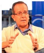
Alberto Acosta Presidente de la Asamblea Constituyente Ecuador 2008